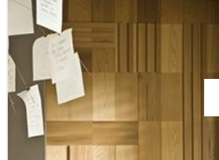
Revêtement de parois en bois